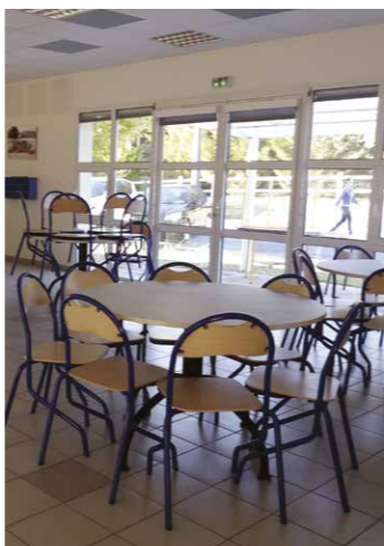
Travaux de rénovation de la façade de l'école Lucie Aubrac. Réception du nouveau mobilier du restaurant scolaire