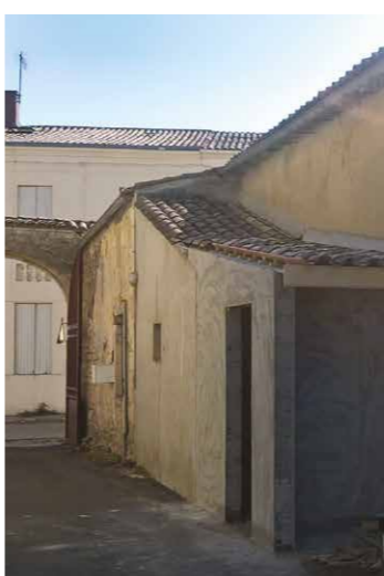
Création d'un accès PMR à l'abbatiale. Création de toilettes publiques (PMR) à l'arrière de la Mairie