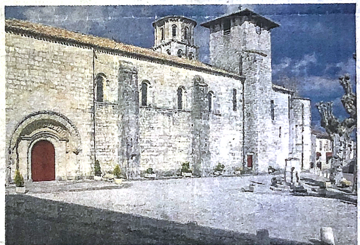
Le porche bientôt consolidé. PASCALE MOINET-CORDONNIER

Une trentaine d'étudiants devrait être présente quotidiennement sur le site du futur pôle universitaire de Vertheuil pour suivre les différentes formations. Pour les accueillir, la commune a pensé à une solution : la maison de retraite Fondation Roux et le foyer occupational Laride. D'ici 2026, la Fondation Roux devrait centraliser ses structures à Lesparre et donc laisser vacant le